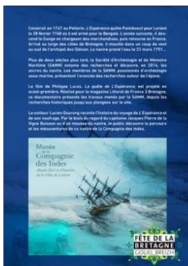
La nuit européenne des musées 2018

Samedi 19 mai 2018, de 20h à 24h (dernières entrées à 23h, horaires sous réserve de modification) Musée de la Compagnie des Indes Citadelle de Port-Louis Entrée libre, dans la limite des places disponibles