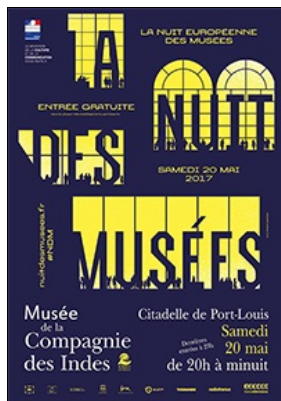
La nuit des musées samedi 20 mai 2017