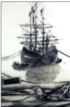
Conférence 2018 Le Lan