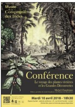
Conférence 2018 Chandeigne