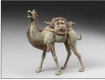
Conférence 2018 Béguin