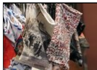
Étuis à lunettes