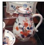
Pot à lait Imari