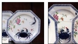
Assiette au crabe