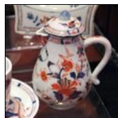
Pot à lait Imari