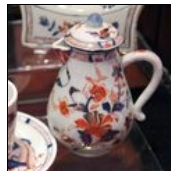
Pot à lait Imari