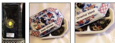
Sachet de thé