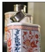
Boîte à thé Imari