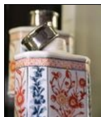
Boîte à thé Imari