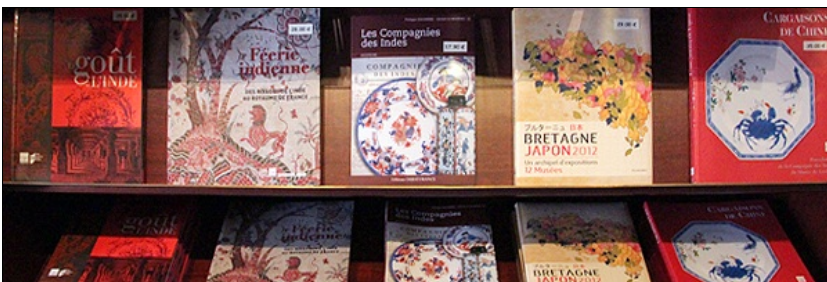
La librairie du musée

La librairie-boutique propose les ouvrages suivants, qui peuvent être vendus par correspondance. Lire la suite