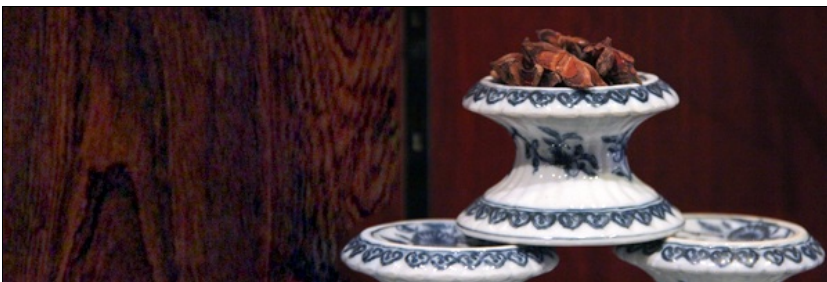
Les objets de la boutique

La boutique du musée de la Compagnie des Indes vous propose un ensemble de porcelaines, réalisées en Chine, par des artisans locaux. Répliques de pièces conservées au musée, ce sont donc des exclusivités, destinées Lire la suite