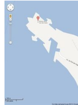
Carte d'accès à la citadelle. Cliquer pour ouvrir Google maps