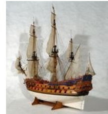
Maquette du "Soleil d'Orient"