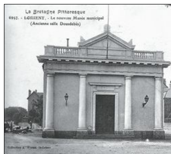
Ancienne salle Dousdebès