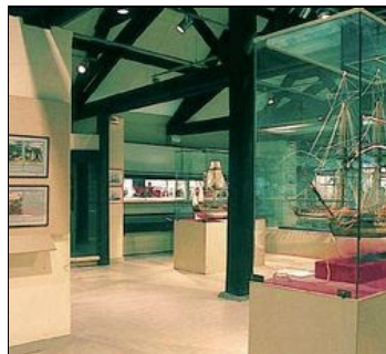
Ancien parcours permanent