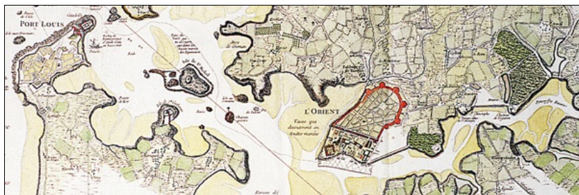
Environs de Lorient et du Port-Louis

Le musée de la Compagnie des Indes, musée municipal de la Ville de Lorient est un musée d'art et d'histoire classé parmi les musées de France. Ce musée est installé depuis 1984 dans la citadelle de Port-Louis et évoque, à travers ses collections l'histoire des Compagnies des Indes françaises, ces compagnies maritimes d'Etat qui bénéficiaient de monopoles de commerce en Afrique, en Amérique et surtout en Asie, et qui furent à l'origine de la Ville de Lorient. Le musée de la Compagnie des Indes n'est pas situé sur son territoire communal, mais à Port-Louis, petite ville côtière de la communauté d'agglomération dont Lorient est la ville centre. Ce territoire est marqué par une vocation maritime historique, à travers des activités de pêche, de commerce et de transport maritime, de défense et de construction navale.