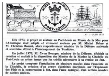
Musée de la mer pour l'Atlantique