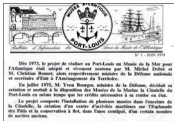
Musée de la mer pour l'Atlantique