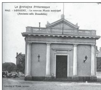
Ancienne salle Dousdebès