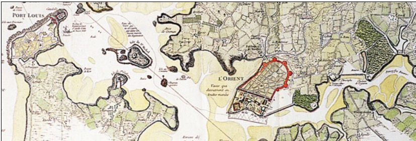
Environs de Lorient et du Port-Louis

Le musée de la Compagnie des Indes, musée municipal de la Ville de Lorient est un musée d'art et d'histoire classé parmi les musées de France. Ce musée est installé depuis 1984 dans la citadelle de Port-Louis et évoque, à travers ses collections l'histoire des Compagnies des Indes françaises, ces compagnies maritimes d'Etat qui bénéficiaient de monopoles de commerce en Afrique, en Amérique et surtout en Asie, et qui furent à l'origine de la Ville de Lorient. Le musée de la Compagnie des Indes n'est pas situé sur son territoire communal, mais à Port-Louis, petite ville côtière de la communauté d'agglomération dont Lorient est la ville centre. Ce territoire est marqué par une vocation maritime historique, à travers des activités de pêche, de commerce et de transport maritime, de défense et de construction navale.