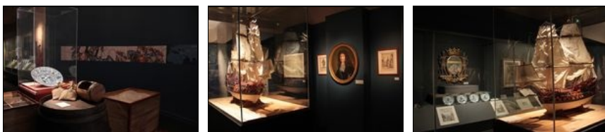
Les premières salles du musée en 2013

Depuis son ouverture, près de 1,5 millions de visiteurs ont découvert la richesse et l'homogénéité des collections du musée, le plaçant parmi les établissements muséographiques les plus fréquentés de Bretagne. Sa thématique, forte et unique en France, n'est nulle part ailleurs aussi légitime qu'à Lorient.