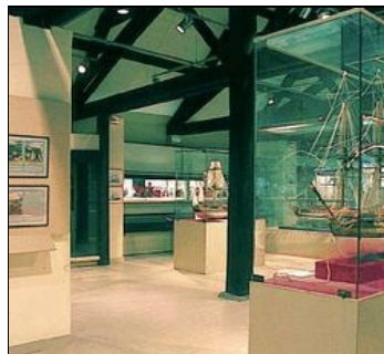
Ancien parcours permanent