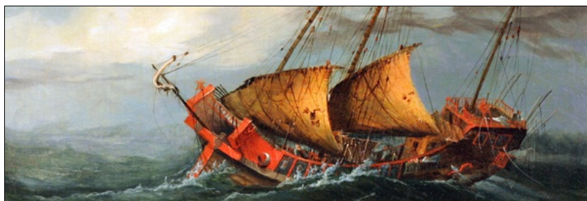
Jonque chinoise par gros temps (détail) / © Musée de la Compagnie des Indes, Ville de Lorient.

La thématique du musée de la Compagnie des Indes, unique en France, fait revivre au visiteur l'extraordinaire histoire des grandes compagnies de commerce des XVII e et XVIII e siècles.