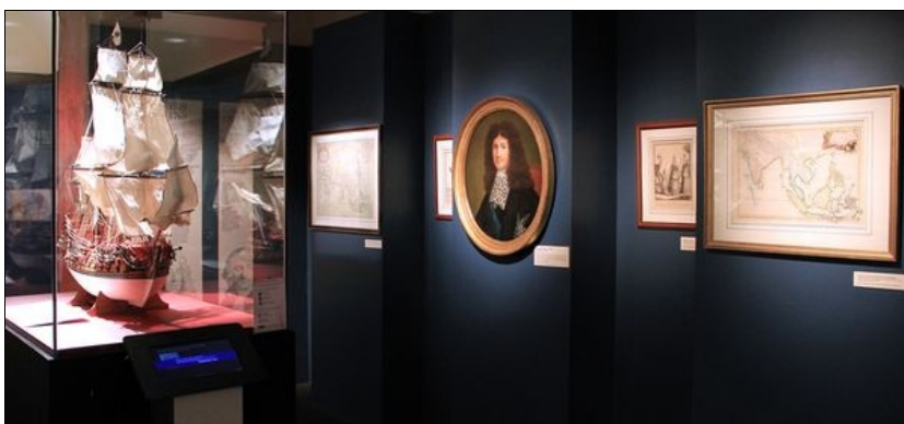
Parcours de référence