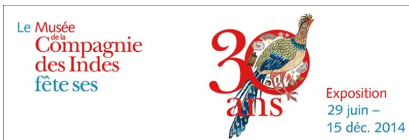
Exposition 30 ans

Elle célèbre les 30 ans du musée de la Compagnie des Indes.