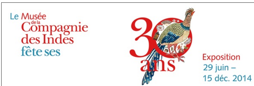
Exposition 30 ans

Elle célèbre les 30 ans du musée de la Compagnie des Indes.