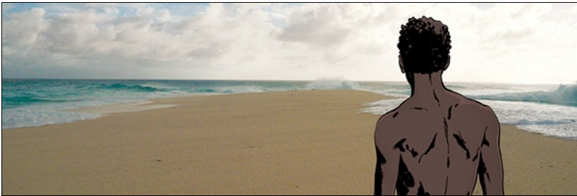
Exposition Tomelin, l'île des esclaves oubliés

Exposition à Lorient du 28 mai au 30 octobre 2016