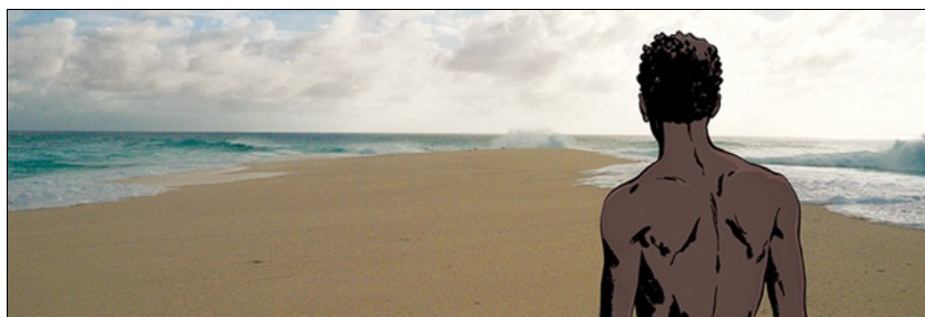
Exposition Tomelin, l'île des esclaves oubliés

Exposition à Lorient du 28 mai au 30 octobre 2016