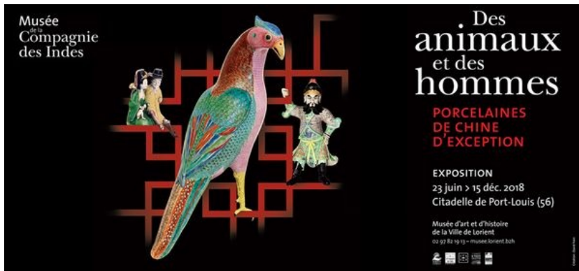
Des animaux et des hommes, porcelaines de Chine d'exception, exposition 2018