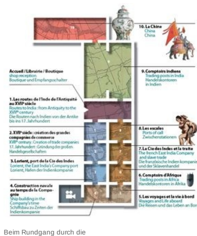
Beim Rundgang durch die

Von Lorient nach Kanton, der Rundgang weckt Erinnerungen an die Expeditionen der Schiffe der Indienkompanie und ermöglicht es dem Besucher, die wertvollen Waren, die für die Europäer so verführerisch waren, in der Atmosphäre der afrikanischen und asiatischen Kontoren zu entdecken.