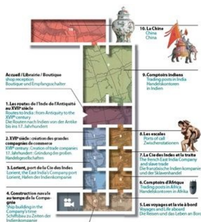
Beim Rundgang durch die

Von Lorient nach Kanton, der Rundgang weckt Erinnerungen an die Expeditionen der Schiffe der Indienkompanie und ermöglicht es dem Besucher, die wertvollen Waren, die für die Europäer so verführerisch waren, in der Atmosphäre der afrikanischen und asiatischen Kontoren zu entdecken.