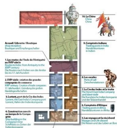
Beim Rundgang durch die