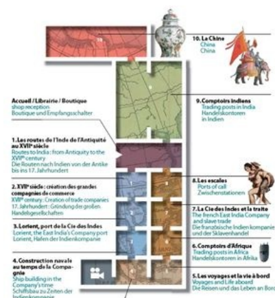
Beim Rundgang durch die