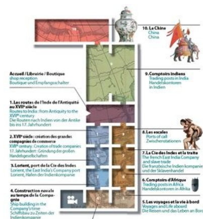
Beim Rundgang durch die