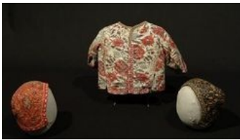
Brassières et béguins d'enfants

- Manteau de femme à la persane : Coton peint à décor de paysages, d'architectures indiennes, d'animaux et sujets européens. Doublure à motifs quadrillés. Inde, Deccan - vers 1800. 140 x 169 cm. Musée de la Compagnie des Indes, Ville de Lorient. Acquis avec l'aide du FRAM Bretagne; Inv. 996.2.1.