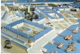
L'enclos de la Compagnie des Indes à Lorient (détail)

Projet de l'architecte Jacques Gabriel pour l'enclos de la Compagnie des Indes à Lorient. Maquette au 1/30e exécutée en 1983 d'après l'Atlas de Guillois (1752)