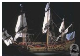
La Flute Le Coche

Musée de la Compagnie des Indes. Inv ML 132