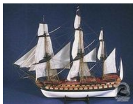
Le Comte de Provence

Le Massiac fut en service pour la Compagnie des Indes de 1759 à 1770.