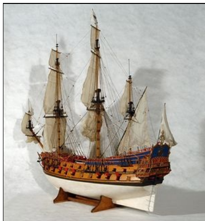
Le Soleil d'Orient, vaisseau de 1000 tonneaux, 60 canons

Maquette en quatre coupes du Comte d'Artois, Jean Delouche