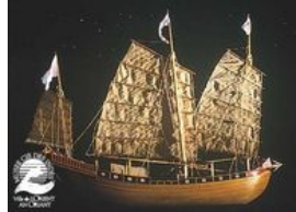
Jonque de guerre chinoise

La maquette fait apparaître les bâtiments édifiés à la liquidation de la Compagnie des Indes en 1769 et ceux projetés qui ne furent jamais construits.