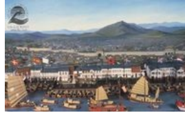
Diorama de la ville de Canton

Don de la Société des Amis du musée. Inv 976.1.1.R