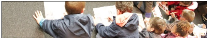
Jeune public et actions pédagogiques

L'animation de l'architecture et du patrimoine est à votre écoute toute l'année pour concrétiser ou définir avec vous votre projet pédagogique et le mettre en oeuvre. Celui-ci peut s'inscrire dans les propositions déjà existantes, mais d'autres thématiques peuvent être élaborées ensemble.