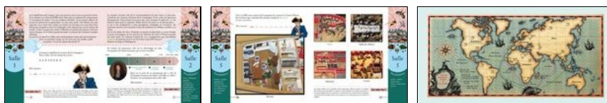
Les aventures de Jean, extrait du carnet de visite