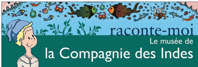
Les aventures de Jean, extrait du carnet de visite