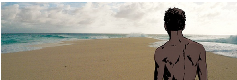
Exposition Tomelin, l'île des esclaves oubliés

Exposition à Lorient du 28 mai au 30 octobre 2016