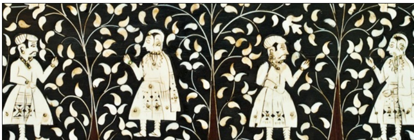
expo en bref