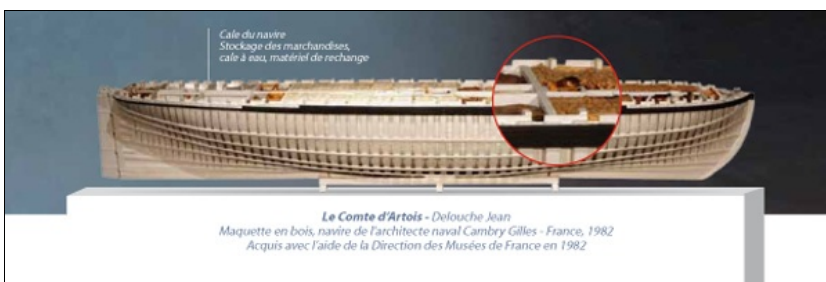
30 oeuvres historiques