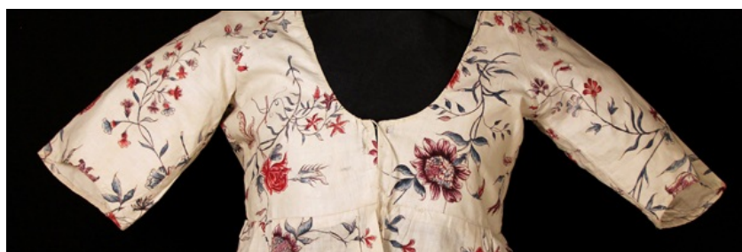
30 nouvelles acquisitions