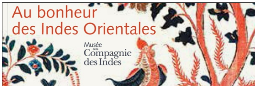
Autour de l'exposition