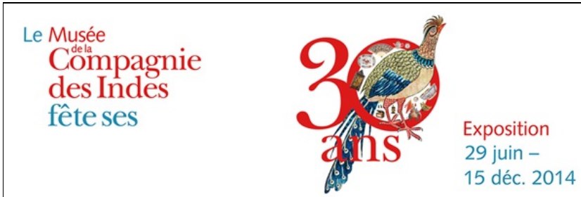
expo 30 ans

Exposition des 30 ans du musée (29 juin – 15 décembre 2014)