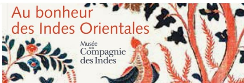
Autour de l'exposition