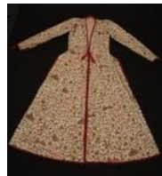
Manteau de femme à la persane