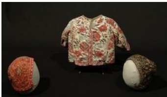
Brassières et béguins d'enfants

- Manteau de femme à la persane : Coton peint à décor de paysages, d'architectures indiennes, d'animaux et sujets européens. Doublure à motifs quadrillés. Inde, Deccan - vers 1800.140 x 169 cm. Musée de la Compagnie des Indes, Ville de Lorient. Acquis avec l'aide du FRAM Bretagne; Inv. 996.2.1.