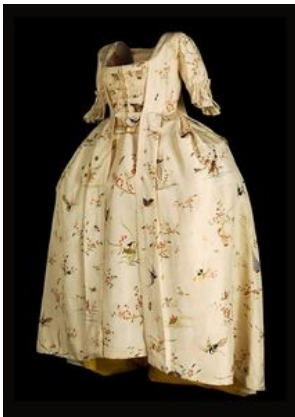
Robe à la Française